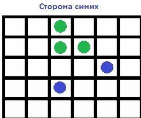
Сторона синих Сторона зеленых Партия окончена

Игра заканчивается тогда, когда все шашки одного игрока окажутся позади шашек противника. Это такая ситуация, в которой игроки уже не могут рубить шашки друг друга. Цель игры набрать максимум очков. Очко